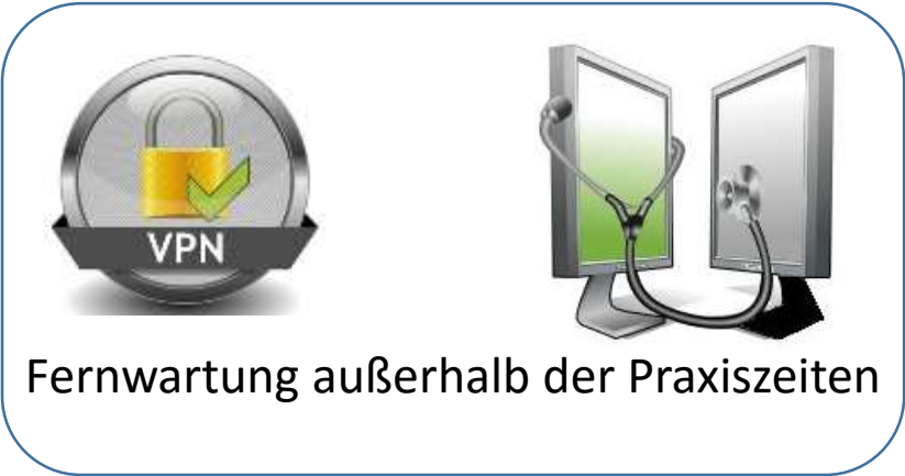
Fernwartung außerhalb der Praxiszeiten