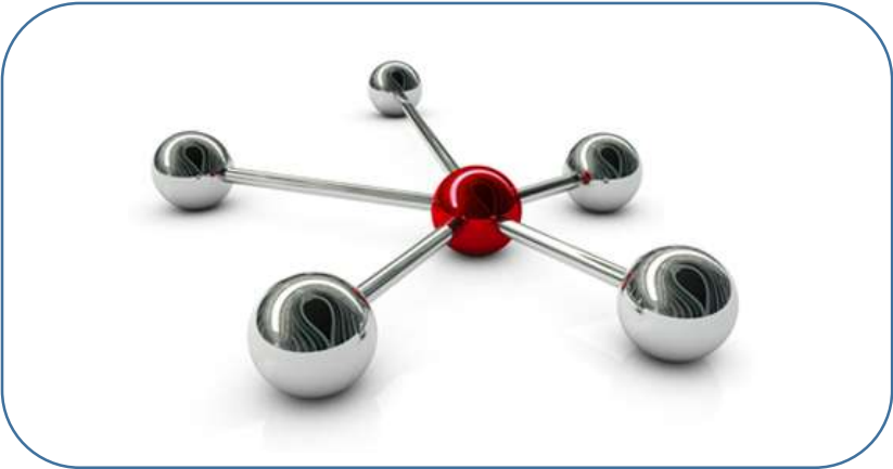
Weniger technische Ansprechpartner