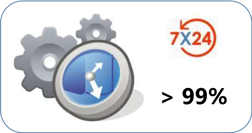
Hochverfügbarer störungsfreier Praxisbetrieb