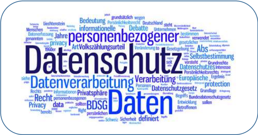
Sicherheitsstandards §203 StGB